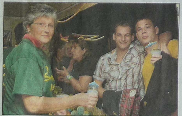
Erfrischende Cocktails: Mit großen Einsatz und viel Spaß bei der Arbeit bedient die Mitglieder des Fördervereins die Besucher der 4. „Hot Summer Night“ im Sinner Waldschwimmbad.

Was sich danach am nächtlichen Himmel abspielte, war ein Meisterwerk an Farbenpracht und Formenvielfalt. Da stürzten weiße Wasserfälle in Richtung Becken, bildeten sich wahre Galaxien und zischten