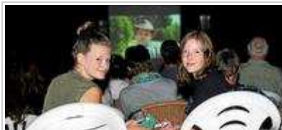
Bei Temperaturen weit über 20 ...

Sinn (uhk/s). Die erfolgreiche Premiere eines neuen Genres haben am Freitagabend der Förderverein des Sinner Waldschwimmbades und der örtliche Filmclub "Athenia" mit der ersten "Sinnema"-Nacht gefeiert.