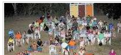
Mit 80 Besuchern erlebte die ...

Mit ihrem aktuellen Streifen "Die letzte Kugel" brachten die Cineasten den Wilden Westen auf die Großleinwand unterhalb des Fünfmeterturms.